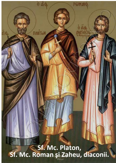
Sf. Mc. Platon, Sf. Mc. Roman și Zaheu, diaconii.

Sf. Mc. Zaheu. Sfântul mucenic Zaheu, diaconul bisericii Gadirilor, a fost dus înaintea judecătoriei închinătorilor de idoli, având pre grumazii săi un lanț greu de fier. Și întrebând fiind de judecător, a mărturisit în privescându-l pe Hristos. Deci a fost muncit, cu grele și crude chinuri ( Mineiele, III, pp. 268, 269 )