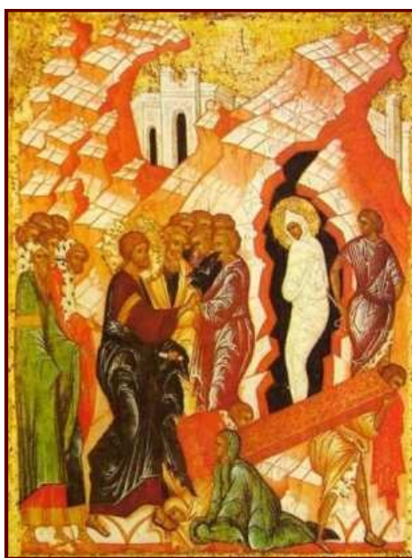
Învierea lui Lazăr