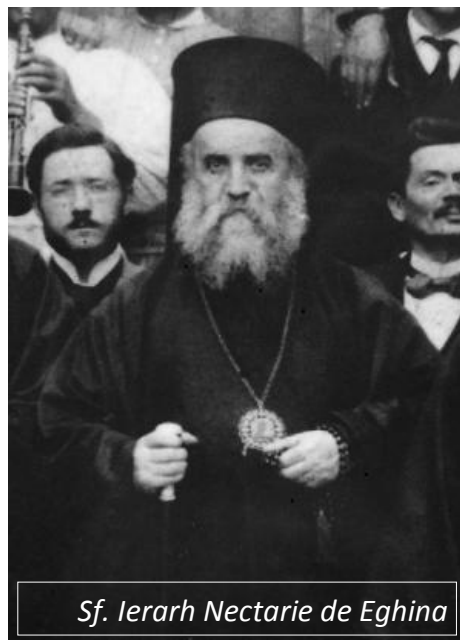
Sf. Ierarh Nectarie de Eghina

Dar nu este atât de greu să fii și tu unul dintre ei, indiferent de locul unde