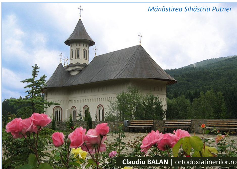
Mănăstirea Sihăstria Putnei