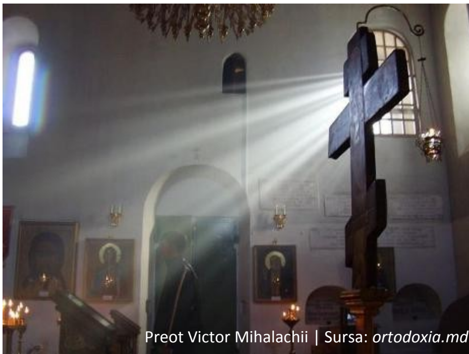
Preot Victor Mihalachii