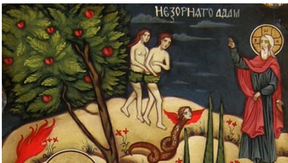
Dumnezeu dă primilor oameni porunca postului (Facerea 2, 16-17)