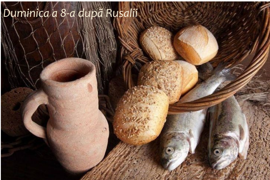
Duminica a 8-a după Rusalii