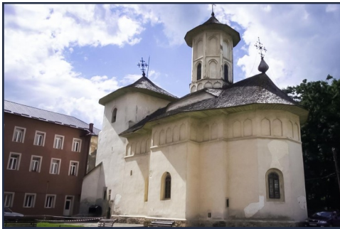
Biserica voievodală de la Bisericani