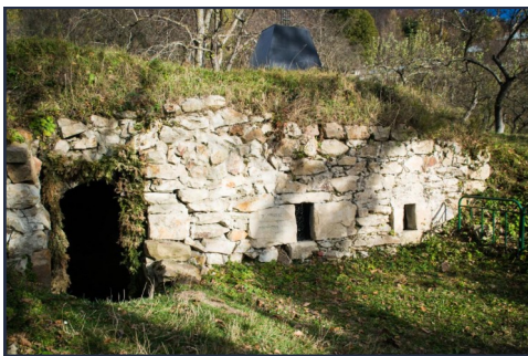
Peștera Sfinților Cuvioși Iosif și Chiriac