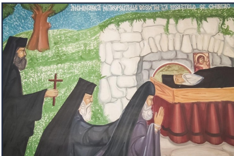
Mitropolitul Dosoftei închinându-se la moaștele Sfântului Chiriac de la Bisericani (detaliu frescă din paraclisul cu hramul „Acoperământului Maicii Domnului” de la Bisericani)