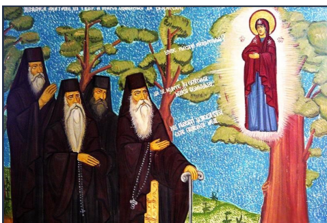
Minunea arătării Maicii Domnului la stejarul de la Bisericani