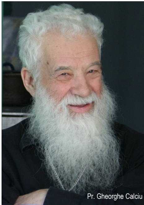
Pr. Gheorghe Calciu

Când muncești cinstit acolo unde te afli și când seara te întorci ostenit, dar cu zâmbetul pe buze la ai tăi, aducând cu tine o