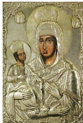
Icoana Maicii Domnului de la Mănăstirea Neamț