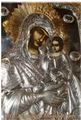
Icoana Maicii Domnului de la Mănăstirea Horaița