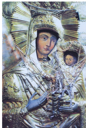
Icoana Maicii Domnului de la Mănăstirea Giurgeni