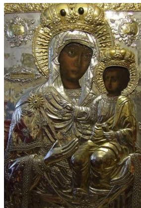
Icoana Maicii Domnului de la Trifești