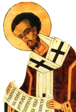
Sfântul Ioan Gură de Aur

gat din templu, dar Lazăr era un om de înaltă clasă socială, așa cum este evident din numărul oamenilor care au venit pentru a o mângâia pe sora sa... I-a înfuriat pe toți, văzându-i mergând în Betania, părăsind sărbătoarea care atunci începuse.