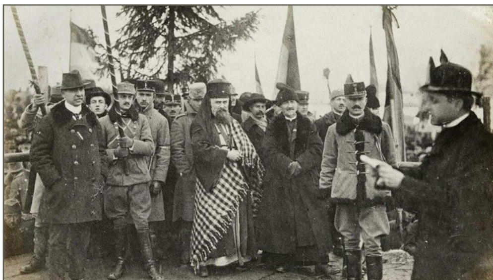
Episcopul Greco-catolic Iuliu Hossu citește proclamația de unire a Transilvaniei cu România

Unirea Transilvaniei cu România încheie procesul de făurire a statului național unitar român, proces început în 1859, prin unirea Moldovei cu Țara Românească, continuat prin unirea Dobrogei în 1878, a Basarabiei în martie 1918 și a Bucovinei în noiembrie 1918. Suprafața României Mari: 295.049 km pătrați, cu o populație de 16.500.000 de locuitori.