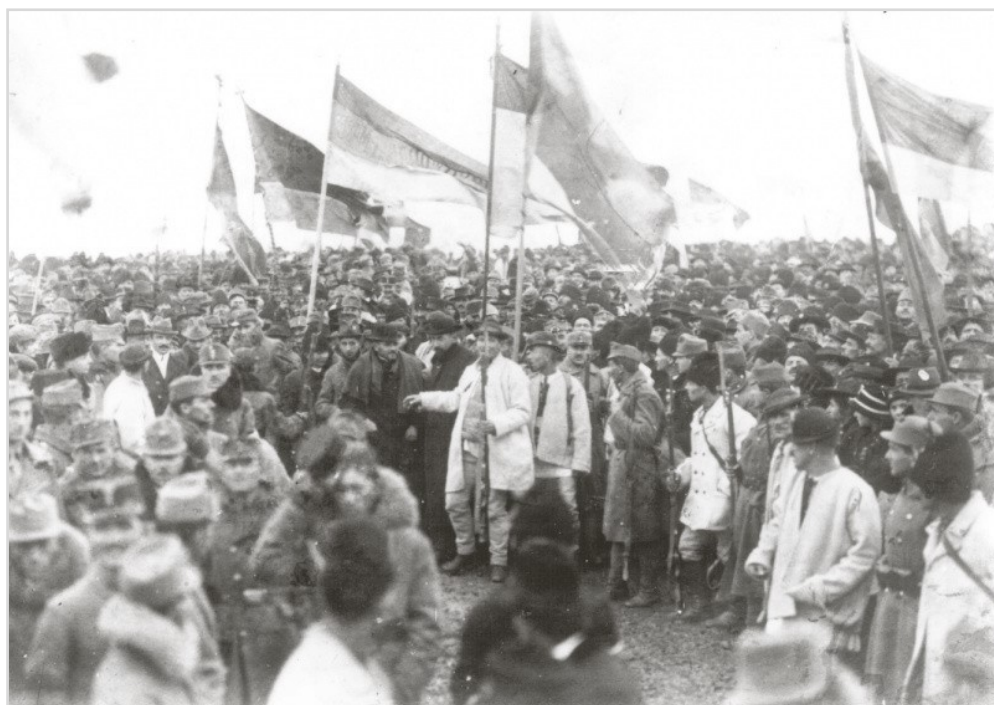
Participanți la Marea Adunare de la Blaj